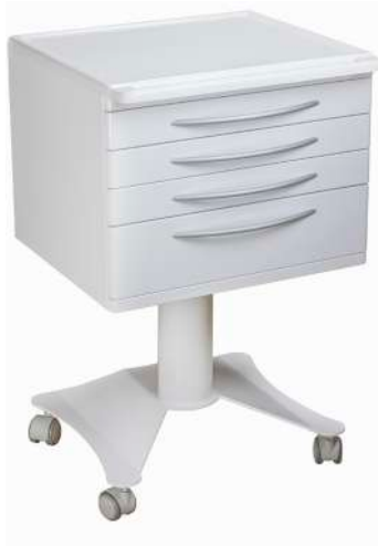
ZILFOR Carrito rodable 4 cajones