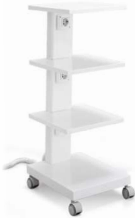
ZILFOR Carrito móvil de cuatro estantes